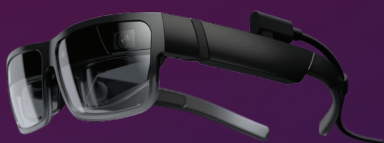
ThinkReality A3 XR1 3G+32G

Eine vollständige Liste mit den Optionen und Zubehör finden Sie unter: