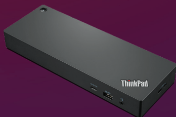
ThinkPad Workstation Thunderbolt™ 4-Dock