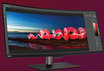
ThinkVision P40w Display